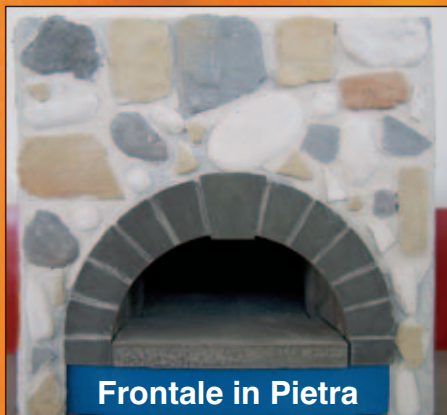
Frontale in Pietra