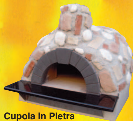
Cupola in Pietra