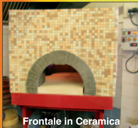
Frontale in Ceramica